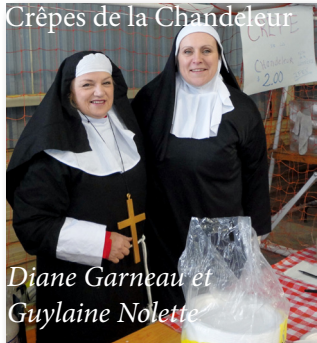
Crêpes de la Chandeleur