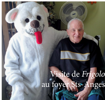
Visite de Frigolo au foyer Sts-Anges