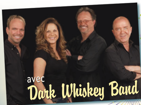
avec Dark Whiskey Band

Samedi 28 juin 2014, 20h à l'Aréna de Ham-Nord Admission générale 20$