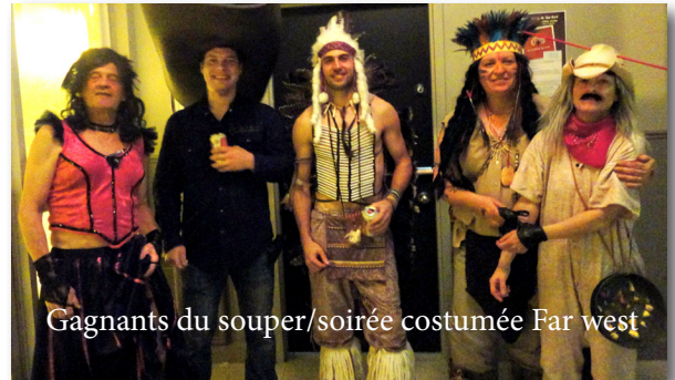
Gagnants du souper/soirée costumée Far west