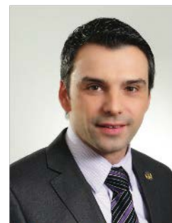
Sébastien Schneeberger Député de Drummond-Bois-Francs