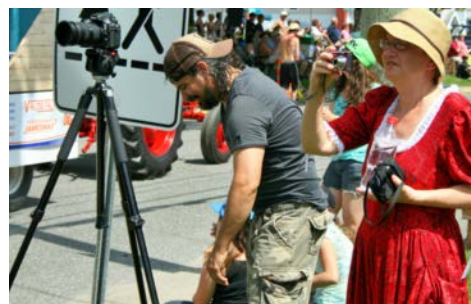
LA PARADE... VUE DE HAUT!

Merci à tous ceux qui travaillent dans l'ombre pour organiser des événements mémorables, et sécuritaires!