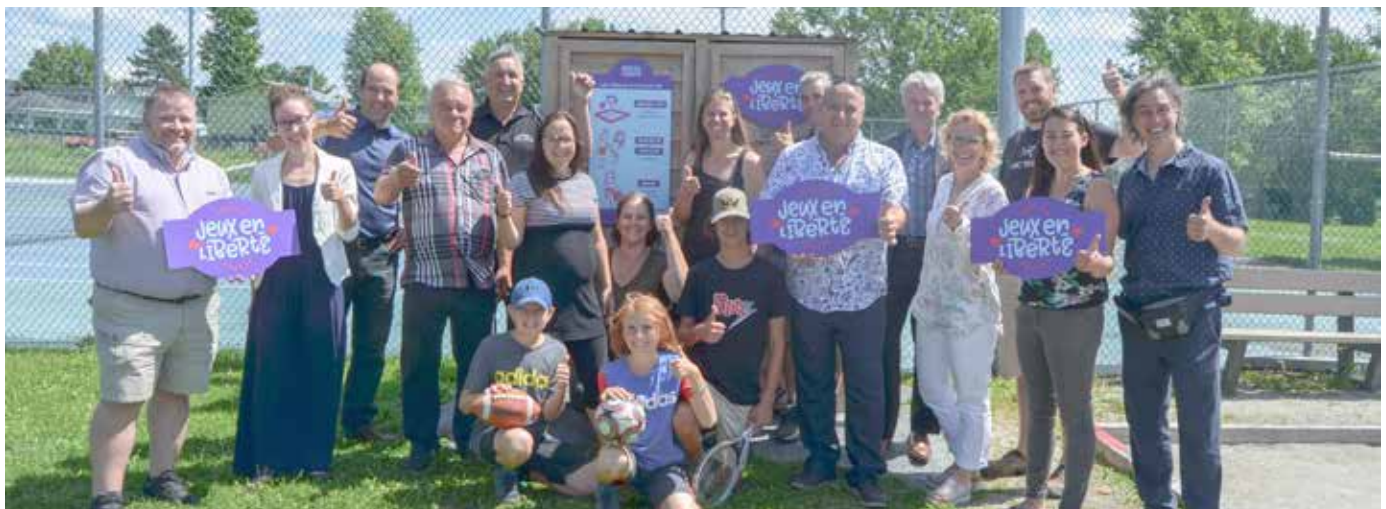
INAUGURATION DE LA BOÎTE «JEUX EN LIBERTÉ» à Ham-Nord